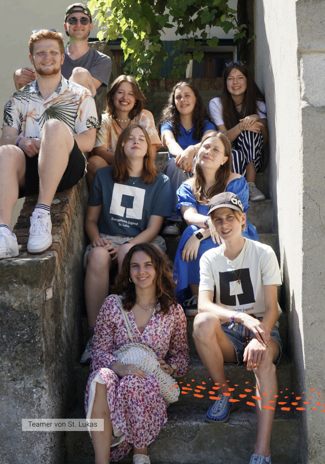
Teamer von St. Lukas